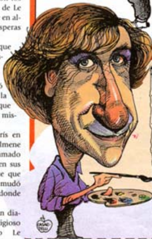
• Uno de los dibujos de Plantu