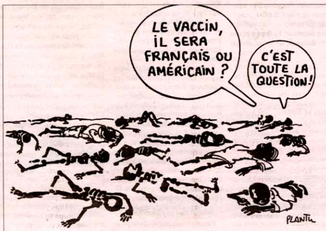
- Το εμβόλιο θα είναι γαλλικό ή αμερικανικό; Αυτό είναι το άλλο θέμα!

Φοβάμαι ότι ο φόβος θα φωλιάσει στο μυαλό των αρχισυντακτών, ενώ πρέπει να συνεχίσουμε να χρησιμοποιούμε τις ενδοκλιτικές εικόνες, αλλά ελέγχοντας την ενδόκλι-