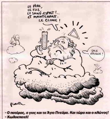
- Ο Πατέρας, ο γιος και το Άγιο Πνεύμα. Και τώρα και ο κλώνος! - Καλοσποχή!

πρέπει να ξέρουμε πού βαδίζουμε». Και καθώς πολλές δημοφιλείς απαγορεύσεις τη δημοσίευσή των αντισημιτικών σκίτσων του αραβικού κόσμου, δεν γνωρίζουμε τον αραβικό κόσμο! Το αποτέλεσμα είναι ότι έτσι δεν δημιουργούμε κανέναν διάλογο. Αυτό επιδιώκω να κάνω με τον Κόφι Αναν: να διερευνήσουμε το πώς μπορούμε να είμαστε πολιτικά ουδέτερες, βίαιοι και επιθετικοί, αλλά μέχρι ενός σημείου.