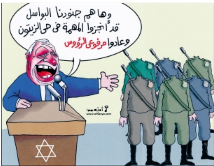
Texte du dessin. Ariel Sharon : « Et voici nos soldats après avoir rempli leur mission dans le quartier de Zeitoun [à Rafah], ils reviennent la tête haute. »