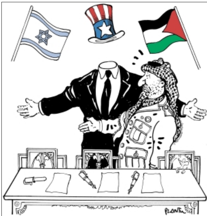
A droite, le dessin signé par Yasser Arafat. « Est-ce que vous pouvez faire signer Sharon sur ce dessin ? », a demandé le chef de l'Autorité palestinienne. « J'ai peu d'espoir », a répondu Plantu.