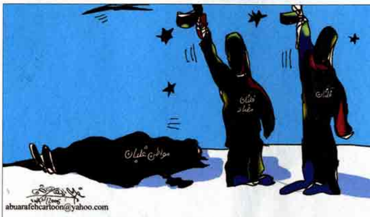
Dessin de Khalil Arafah. Légende : Chaos A (Fatah), chaos B (Hamas) et la victime : le peuple palestinien. Ci-dessous, dessin de Michel Kichka.